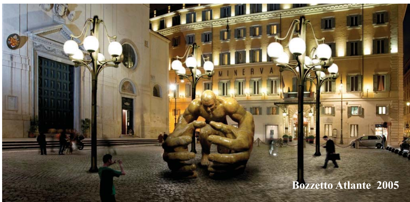
Bozzetto Atlante 2005

All'interno, sui palmi delle mani, sono sovrainpressi i contorni dei continenti della Terra, ultima traccia di un mondo ormai perduto.