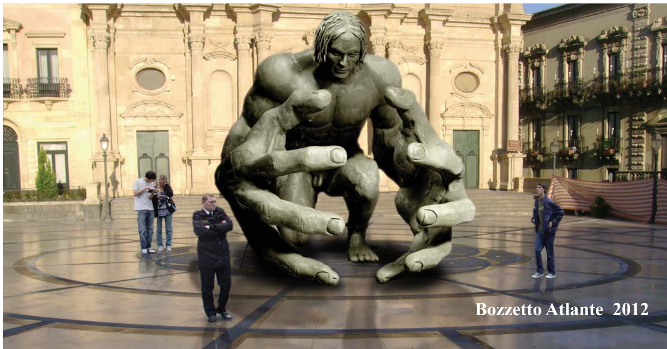
Bozzetto Atlante 2012